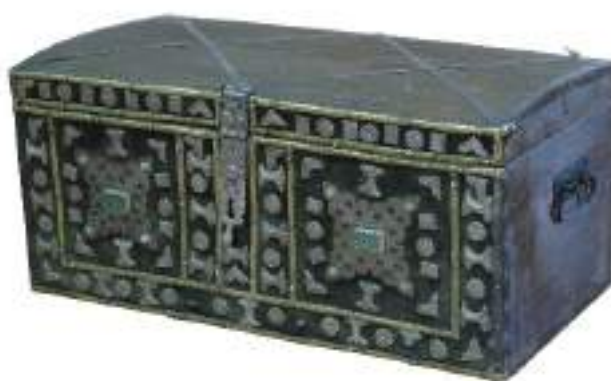
5-сурет – Сандық. ҚРММ қоры. КП22777