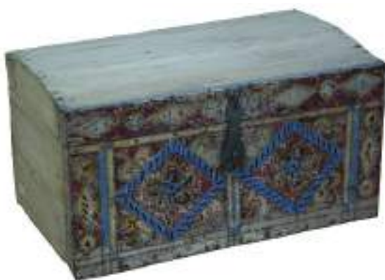
4-сурет – Сандық. ҚРММ қоры. КП19426