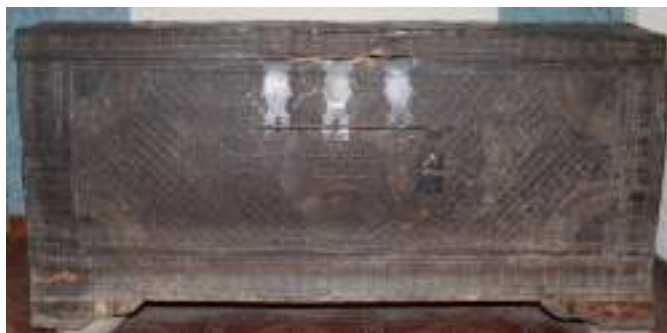
2-сурет – Абажа. Арал тарихи өлкетану музейі

арнайы қалыптармен бастырып (3-сурет), безеп түсірген, сондай-ақ ұста бізі арқылы шекіп ою өрнек салған түрі. Үшіншісі, күміс құймалармен безендіргені (5-сурет).