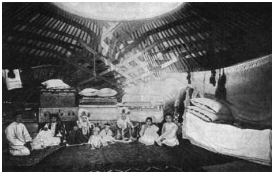
1-сурет – Төрде сандық пен тең жиналған киіз үй (Лавров, 1916)

В. Лавровтың Қазалы уезінен түсірілген бай қазақтың киіз үйінің жабдығы көңіл аударарлықтай, бұл фотоқұжатта киізбен қапталған сандықтардың киіз үйдің төрінде жиналып, бірнеше теңді ұстап тұруы үй иесінің байлығын көрсетеді (Лавров, 1916; 1-сурет).