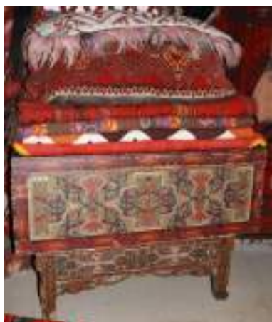
8-сурет – а) Сүйектелген кебеже Қызылорда облыстық тарихи-өлкетану музейі; ә) Ағаш кебеже. Оймыш. Сырдария экспедициясы материалдарынан